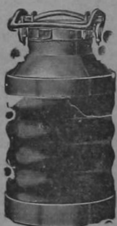
Almacenes al por mayor